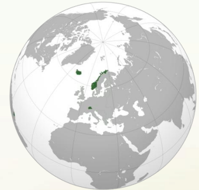
ЕАСТ окончательные переговоры