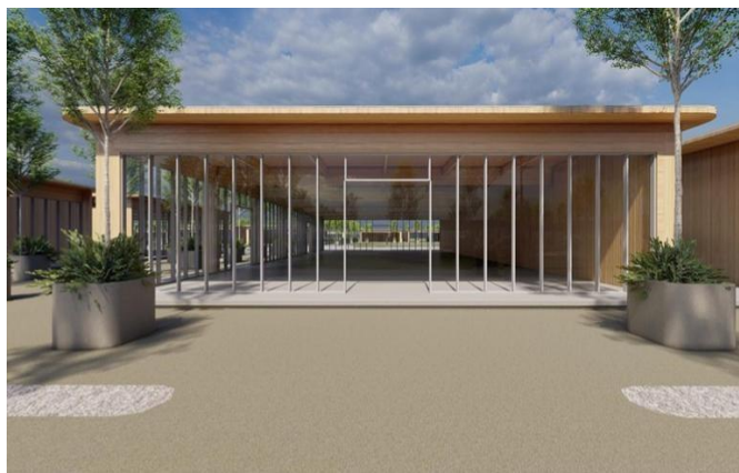
Paviljon najboljih praksi

Uvode se najnoviji modeli ekološki prihvatljivih vidova transporta koji ne zagađuju životnu sredinu. Zona najboljih praksi biće izgrađena od drveta poreklom iz Srbije, uz angažovanje domaćih firmi. Nakon završetka EXPO-a, ova zona će biti rasklopljena, a materijal se može demontirati i ponovo iskoristiti za potrebe obrazovnih ustanova i parkova. To znači da će oko četvrtina EXPO kompleksa biti dizajnirana kao modularna konstrukcija koja će posle izložbe biti prenamenjena za izgradnju škola i vrtića.