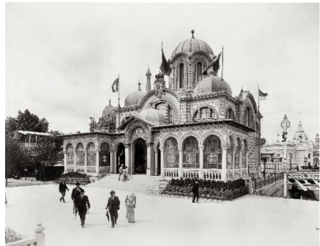
Expo 1900 Pariz – Paviljon Srbije u tradicionalnom srpsko-vizantijskom stilu

Još jedna izložba, na kojoj je učešće naše zemlje zapaženo, bila je u Parizu 1900. godine , na Seni, gde su predstavljeni naši proizvodi ( hrana, minerali, tkanine ) na specijalno izgrađenom paviljonu, veličine 550 m 2 , u obliku srpsko-vizantijske crkve. Budući da je tada bilo nagrađivanja za izložbenost, dobili smo čak 19 zlatnih, 69 srebrnih i 98 bronzanih medalja.