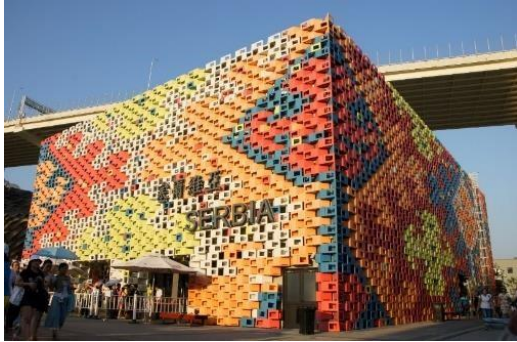
Expo 2010 Šangaj – Paviljon Srbije sa fasadom u stilu tradicionalnog pirotskog ćilima

Od 2000. godine, Srbija je učestovala na još tri izložbe – u Šangaju 2010. godine, u Milanu 2015. i u Dubaiju 2021. godine.