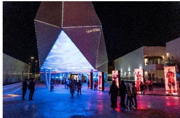
Expo 2020 Dubai - Paviljon Srbije

Na izložbi u Dubaiju u postkovid period, Srbija je svojim impresivnim nastupom privukla pažnju više od milion posetilaca. Tokom predstavljanja na Expo 2020 Dubai, Srbija je ostvarila više od 10.000 poslovnih kontakata i postala tema svetskih medija zahvaljujući nauci i inovacijama, kao i našim proslavljenim umetnicima i sportistima koji su bili deo ovog predstavljanja.